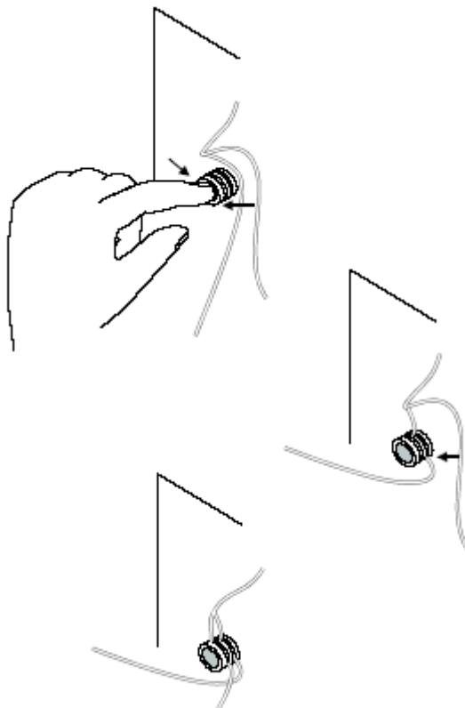
图 6 在夹紧式胶管阀内安装管道